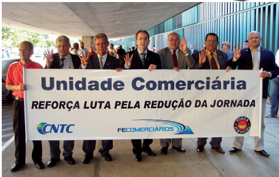
Comerciários, durante manifestação pela redução da jornada de trabalho, no Congresso Nacional, em julho do ano passado

O Dieese acredita que 2010 será um bom ano em termos de crescimento econômico para o país, com reflexos no mercado de trabalho. “A perspectiva, com os dados que já temos em mãos, é de que – salvo alguns acidentes de percurso – este será um ano bom em termos de crescimento econômico e, consequentemente, com reflexos no mercado de trabalho, com a manutenção e até a expansão do emprego e da