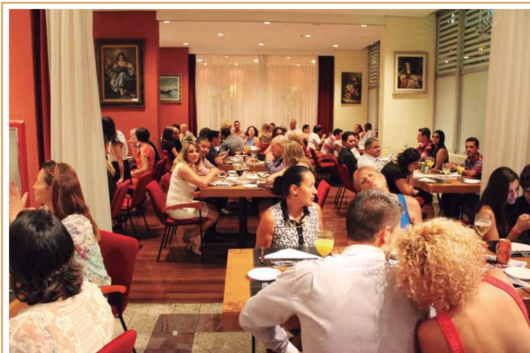
Funcionários, comerciários e sindicalistas presentes ao jantar no Hotel Bristol, Centro de Guarulhos