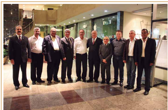
Sindicalistas, autoridades e diretores dos sindicato prestigiaram a comemoração

O Sincomerciários de Guarulhos fica na rua Morvan Figueiredo, 65 7º andar, Centro. Tel.: 2475-6565. Subsede em Itaquaquecetuba, rua Guilhermina Maria Conceição, 79, Centro.