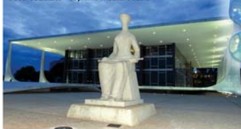
Poder Judiciário – Supremo Tribunal Federal