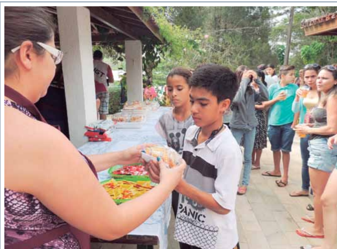
Cachorre quente, chope e refrigerante foram servidos à vontade