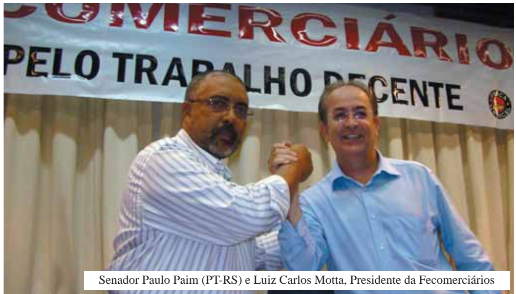
Senador Paulo Paim (PT-RS) e Luiz Carlos Motta, Presidente da Fecomerciantes

O Senador falou sobre vários projetos de sua autoria, como os relativos à estatilidade do dirigente sindical, da redução da jornada de trabalho, do aumento do valor no aviso prévio proporcional, do fim do fator previdenciário e da destinação de recursos do Pré-Sal para a Seguridade Social, entre