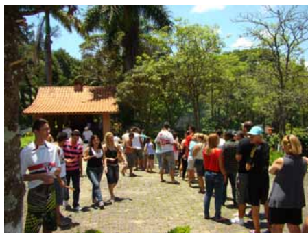
O sol brilhou durante todo o dia