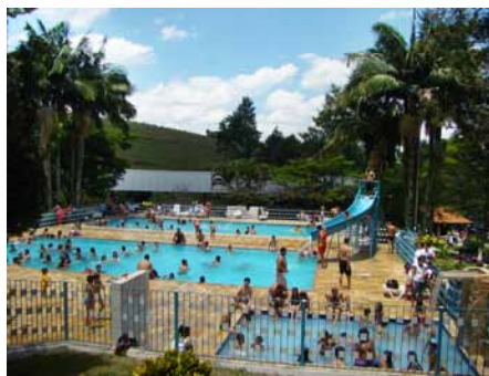
A piscina foi um dos locais mais frequentados