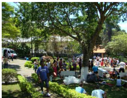
Havia ambulância de plantão no local para atender a qualquer eventualidade