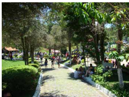
Comerciários curtiram a festa