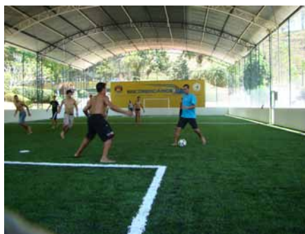
A nova quadra coberta de futebol society foi bastante disputada