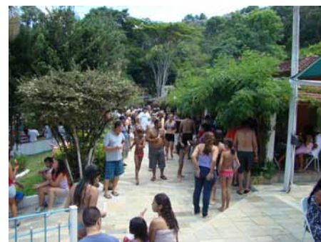
Churrasco à vontade para todo mundo