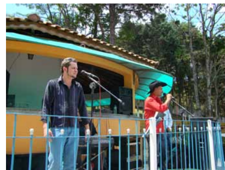
Música ao vivo animou a festa