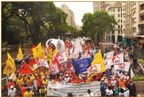
Passeata pelo Trabalho Decente mostra força nas ruas de São Paulo

o setor financeiro em sintonia com um projeto nacional de desenvolvimento inclusivo, reduzindo as taxas de juros e ampliando os recursos para o setor produtivo e para as áreas sociais”.