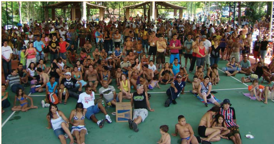
Comerciários aguardam sorteio de prêmios durante a festa de 2009

A Sede Campestre fica na Estrada municipal de Arujá – Santa Isabel, km 56 – bairro Cafundó – tel: 4656-1783.