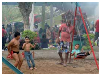
O playground fez sucesso