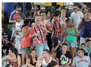
Comerciários fazem a festa