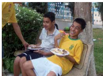
A garotada se divertiu