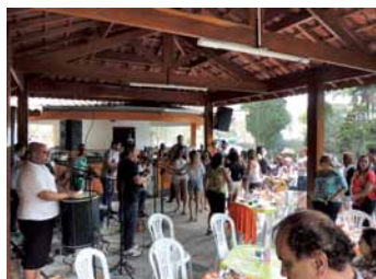
O pagode também rolou solto