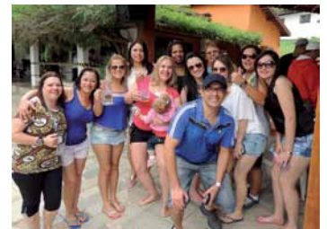
Galera das Casas Bahia