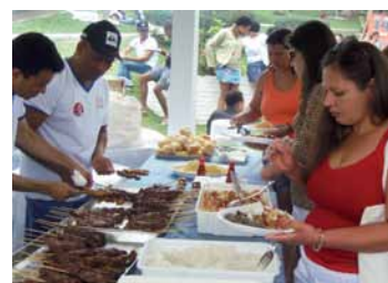
O churrasco foi à vontade