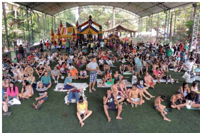
Comerciários aguardam o início do sorteio

Honda 150 CG, também OKM, além de dez tvs tela plana de 28 polegadas, dezenas de ventiladores, furadeiras, batedeiras, tablets, grills, liquidificadores, aparelhos de DVD, micro-ondas, máquinas fotográficas e outros. Veja as fotos nesta edição especial.